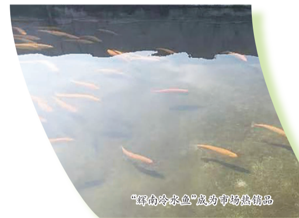
“辉南冷水鱼”成为市场热销品