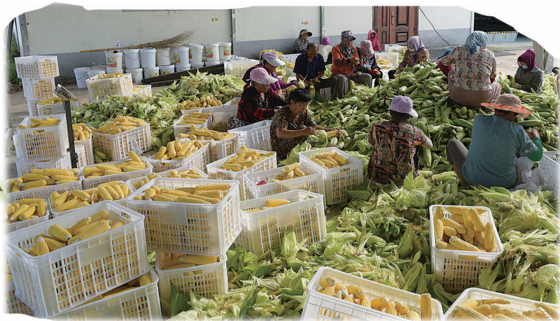
鲜食玉米产业托起辉南农民增收致富新希望