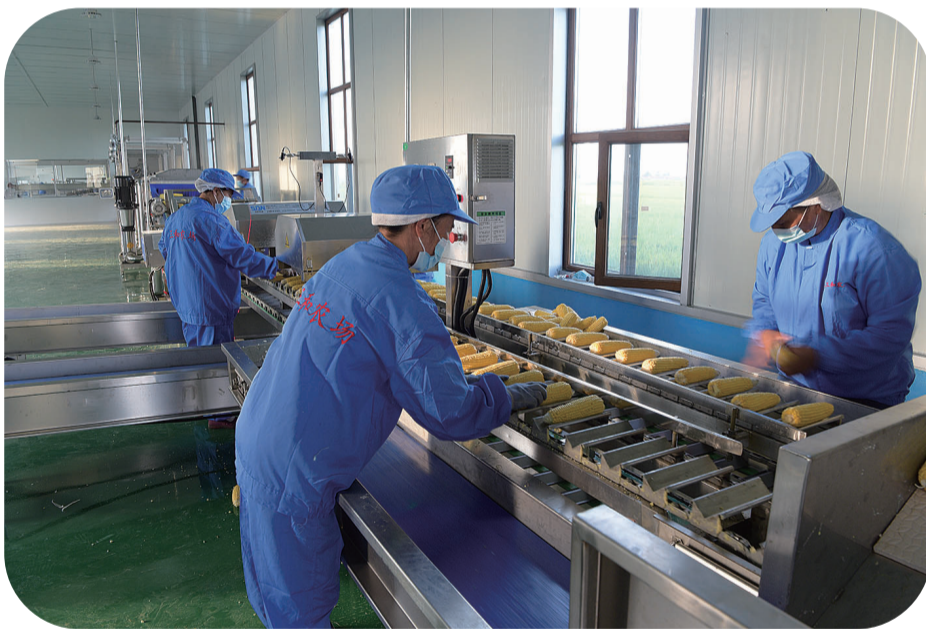
工人在洁净的车间里加工鲜食玉米

在推进农业农村现代化建设的进程中,辉南县充分发挥区域、气候和水资源优势,大力发展鲜食玉米、食用菌和淡水养殖等特色产业,多措并举开展基地建设,持续提升产品质量,努力把资源优势转化为经济优势,加快农民增收的进程。