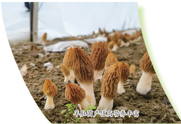
羊肚菌产值高营养丰富