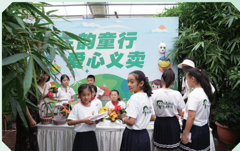
依托农博会君子兰展区组织义卖活动