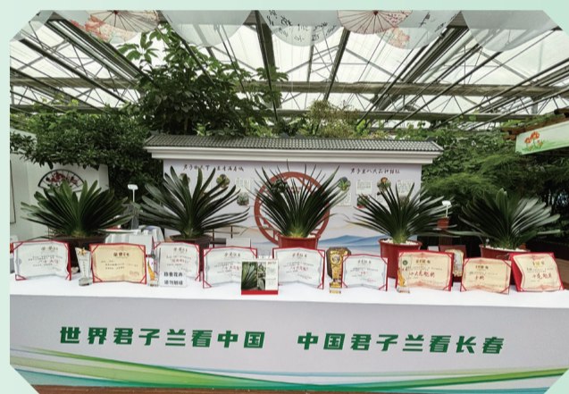
长春君子兰十大花魁展示

君子兰产业年产值已达到20亿元。现有专业养兰户3500户，基地规模达到3000亩，养兰数量超过3亿株。长春已培育出君子兰八大品种特征，形成了独特的品牌及产业优势。这一产业的繁荣不仅为长春市带来了巨大的经济效益，也为当地居民提供了大量的就业机会，促进了社会稳定和经济发展。