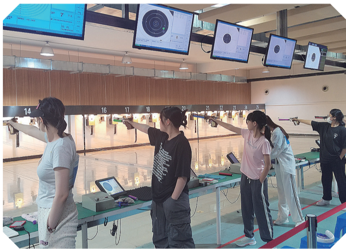
8月6日,2024年吉林省青少年射击锦标赛在吉林市夏季运动管理中心开赛。比赛由吉林省射击射箭运动管理中心主办,吉林市体育局、吉林市夏季运动管理中心承办,为期7天。

长白县农业农村局将持续关注天气情况,组织农技人员狠抓灾后生产恢复,强化监测调查,持续开展救灾补损工作。