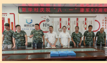
新华村将继续做好退役军人服务保障工作,为退役军人干事创业提供更好的环境,共同建设美好家园。